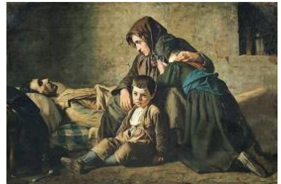
Jean Pierre Alexandre Antigna « La muerte de los pobres », hace referencia al problema social de la pobreza.