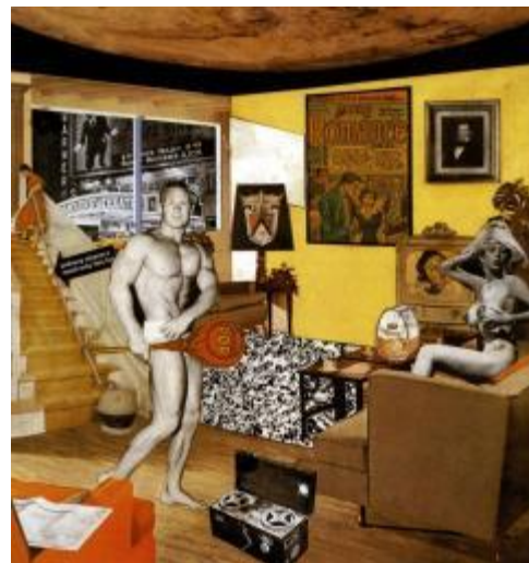
Richard Hamilton 1956 ¿Qué es lo que hace que las casas de hoy sean tan diferentes y tan atractivas? , abarca el problema del consumismo