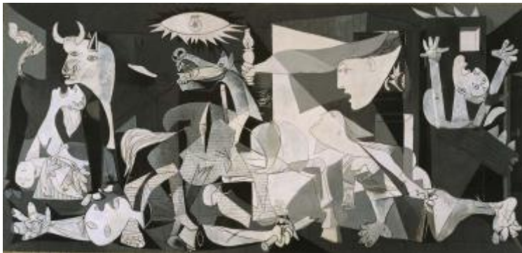
Guernica es un cuadro de Pablo Picasso, alude a un bombardeo ocurrido durante la guerra civil española.

Algunas Obras que incluyen la alguna temática de problemas sociales son: