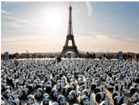
Paulo Grangeon: Pandas de viaje , abarca la problemática del daño medioambiental.